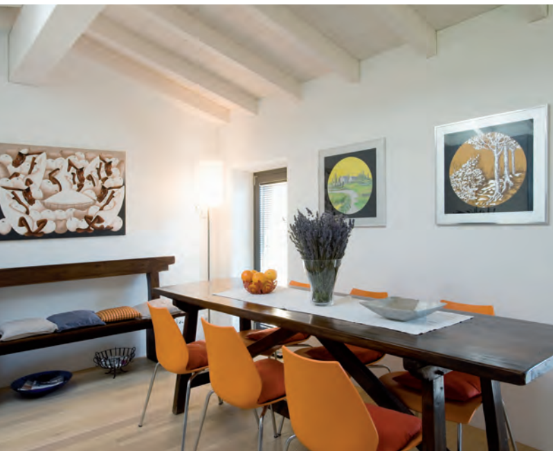
In sala domina il bianco, 'arginato' dal pavimento in parquet e da alcuni oggetti d'arredamento in legno scuro o molto colorati

Uno spazio aperto dove trovano collocazione, da una parte, la cucina inserita nella sala da pranzo e, dall'altra, il salotto. Pavimenti in legno e pareti bianche fanno da cornice ad un arredamento elegante e non convenzionale. L'abbinamento tra oggetti diversi per provenienza e stile denota un gusto e una personalità spiccata del padrone di casa, la ricerca minuziosa del dettaglio e la giustapposizione divertita con gli altri elementi d'arredo. Nella zona pranzo la cucina moderna si affianca al tavolo 'fratino' in legno, circondato da sedie design arancione. Ovunque si diffonde il