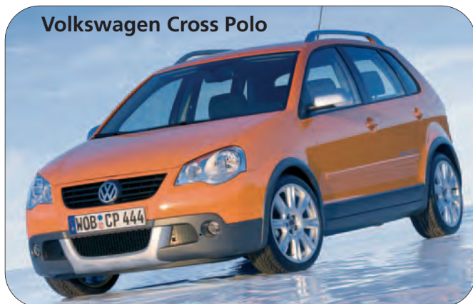
Volkswagen Cross Polo